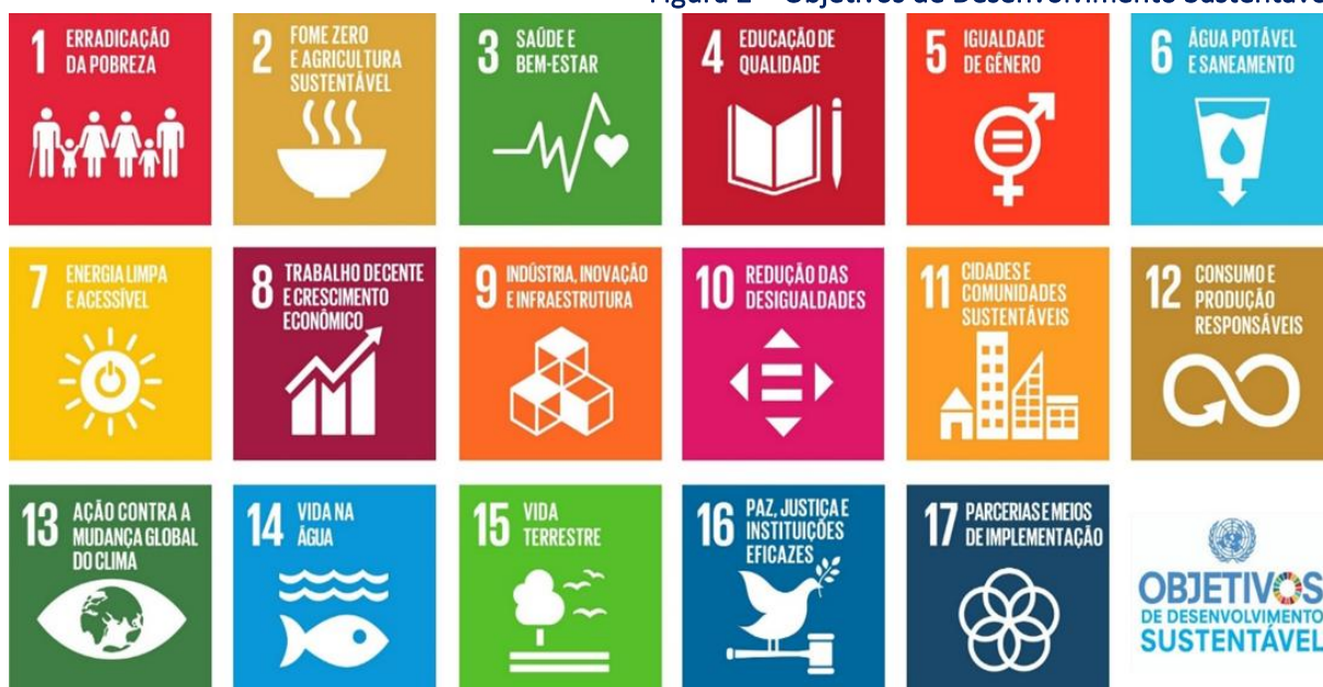
Figura 2 – Objetivos de Desenvolvimento Sustentável

Disponível em: http://www.estrategiaods.org.br/